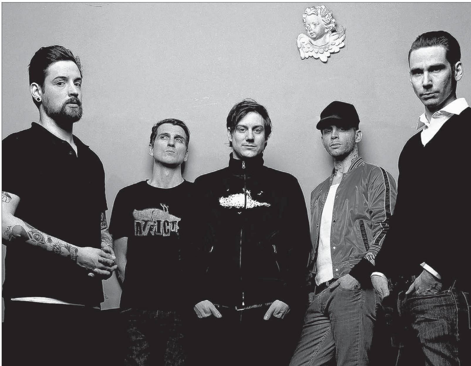
Flensburger Jungs: Turbostaat sind echte Nordlichter. Trotzdem kommen die fünf Musiker auch gerne mal in den Süden, zum Beispiel am 10. Juli für einen Auftritt beim Geislinger Helfensteinfestival.

Tober: Anders. Wir haben vor Weihnachten die Tour beendet und dann erstmal 'ne kleine Auszeit ge-