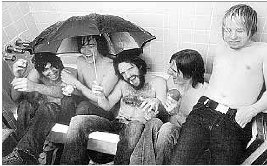
Mit Freunden steht man nie im Regen: Goldrush unter der Dusche.