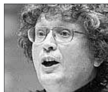
Beseelt: René Jacobs.

Wer dafür heute den Beweis wünscht, möge die 1651 oder 1652 in Venedig uraufgeführte