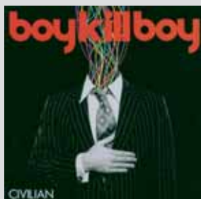
Boy Kill Boy »Civilian« Alternativen Brit-Alternative mit blödem Namen, aber guten Songs.

Da können wir viel schreiben, aber 90 % der Scheiben kauft keiner auf Verdacht. Deswegen - Shops wie iTunes oder Amazon bieten eine Vorhörfunktion. Damit lässt sich unser »hart-aber-herzlich«-Urteil überprüfen. Grundsätzlich gilt: Nicht alles, was wir blöd finden, muss auch blöd sein, denn: Auch wir sind nur Sklaven unseres mittelmäßigen Geschmacks.