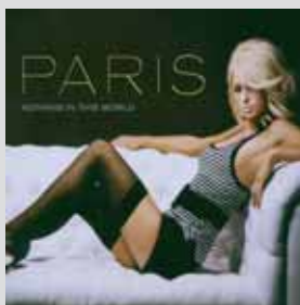
Paris Hilton »Nothing In This World« Blond Dab-Dab, Dab-Dab, Da-Da-Da – tonight (sorry, habe ich jetzt inhaltlich vorgegriffen?)