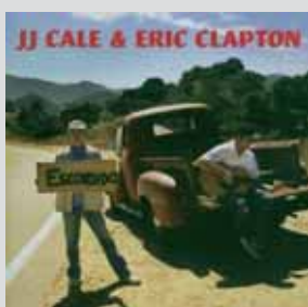
Eric Clapton/J. J. Cale »The Road To Escondido« Blauer Erst dachte ich: Das muss doch nicht. Der erste Eindruck hielt sich hartnäckig (sollte gar kein Reim werden).