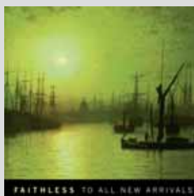
Faithless »To All New Arrivals« Beat-Pop-Flow Sehr relaxt. Bei Faithless denke ich immer ans Reisen. Autobahn-Musik.