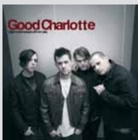
Good Charlotte »Keep Your Hands Off My Girl« Punk-Pop Ich weiß ja nicht. Doch! Langweilig!