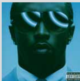
P. Diddy »Testimonial« Sprechgesang Der Typ, na ja. Das Cover – klasse. Die Scheibe – wie der Typ.