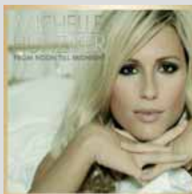
Michelle Hunziker »From Noon Till Midnight« Blonder Schön anzusehen, musikalisch überdurchschnittlich daneben.