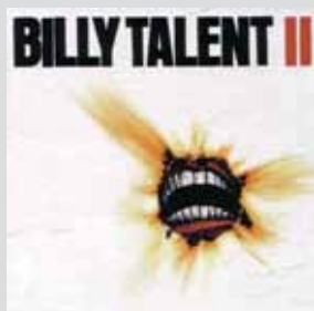
Billy Talent »Fallen Leaves« Mehr Alternativen Single-Auskopplung. Kauft das überhaupt noch jemand, Singles? Egal, fast die ganze CD geht richtig geschmeidig durch das Ohr. Live enttäuschend, aber die aktuelle CD ist klasse.